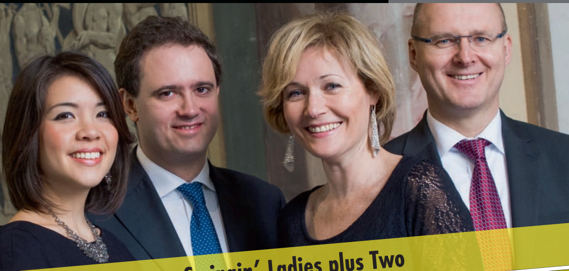
Swingin' Ladies plus Two